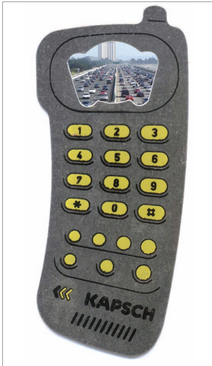
Интеллектуальный Коммуникатор Чиновника

штрафов (любой ценой) жабой душит, да и просто желание – доминировать! Вот так они – чиновники устроены (наверное, на генетическом уровне), всех к ногтю. А их у нас ни много ни мало – около 2-х миллионов! Причём на любом уровне иерархии и рода функционирования, в том числе и в нашей области.